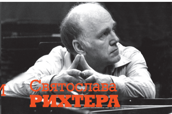
И Святослава РИХТЕРА